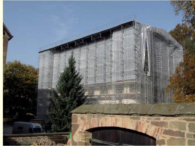
Jagdschloss, eingerüstet für die Instandsetzung