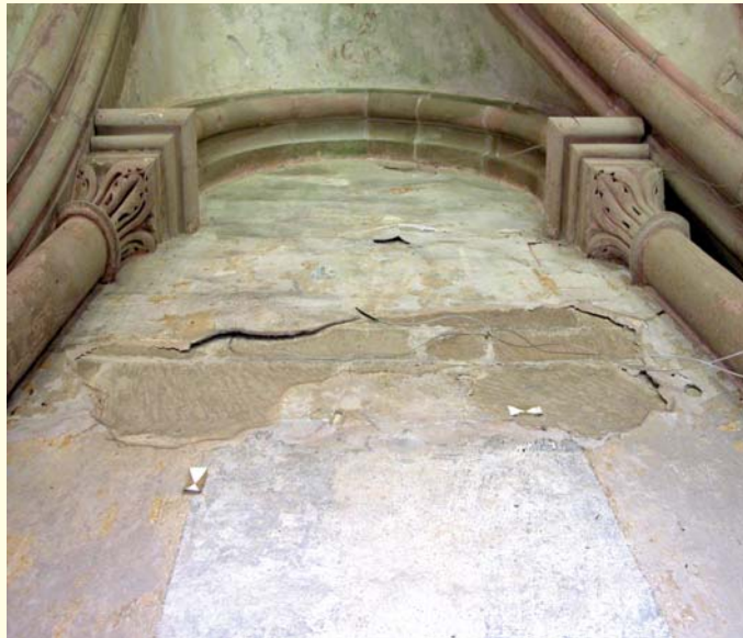
Putzablösungen im südlichen Kreuzgang

Stein für Stein wurden in den letzten Jahren der Ostbau der Maulbronner Klosterkirche und der Kreuzgang untersucht. Diese Beobachtungen, manchmal in Verbindung mit älteren Forschungen und schriftlichen Überlieferungen, geben überraschende und neue Einblicke in die komplizierte Planungs- und Baugeschichte sowie in die Bauorganisation der zisterziensischen Klosteranlage. Die aus dem Elsass stammenden Mönche mussten ihre Vorstellungen vom „richtigen Bauen“ mit wechselnden Bautrupps realisieren. Dabei wurden viele einzigartige und ungewöhnliche Lösungen gefunden. Illustriert mit zahlreichen Bildern werden die wichtigsten neuen Entdeckungen und Überlegungen vorgestellt.